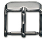
3000 INOX Edelstahl 304 poliert Breiten (mm): 14, 16, 18, 20 Gewisse Breiten auch in vergoldet erhältlich, kontak- tieren Sie uns für Details.