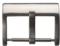
3020 INOX satiniert Edelstahl 304 satiniert Breiten (mm): 14, 16, 18, 20, 22, 24, 26, 28, 30