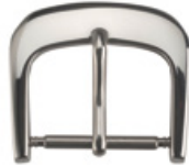
3031 INOX Edelstahl 304 poliert Breiten (mm): 12, 16, 18, 20 Gewisse Breiten auch in PVD erhältlich, kontaktieren Sie uns für Details.