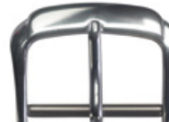
3107 Aluminium weiss Breiten (mm): 10, 12, 14, 16, 18