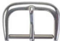
3103 Aluminium weiss Breiten (mm): 10, 12, 14, 16, 18