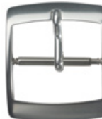
3109 Aluminium weiss Breiten (mm): 8, 10, 12, 14, 16, 18

Schnallen aus Edelstahl und Aluminium, oft auch als Schliessen bezeichnet, sind unsere Hauptprodukte. Unsere Standardmodelle sind in verschiedenen Materialien, Ausführungen und Breiten kurzfristig ab Lager lieferbar. Sie werden immer 3-teilig, also nicht montiert, geliefert. Edelstahl-Schnallen werden auf Paletten zu 50 Stück verpackt, die Paletten sind zum Schutz der Schnallen mit Velours überzogen. Die Dorne und Federachsen sind in separaten Beuteln verpackt.