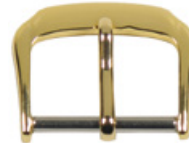
3106 Aluminium gelb Breiten (mm): 10, 12, 14, 16, 18