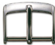
3014 INOX Edelstahl 304 poliert Breiten (mm): 8, 10, 12, 14, 16, 17, 18, 19, 20, 22