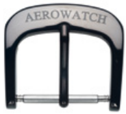
3031 PVD schwarz Logo in Laser schwarz