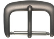
3700 TITAN Titan matt Breiten (mm): 14, 16, 18, 20