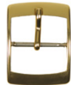
3108 Aluminium gelb Breiten (mm): 8, 10, 12, 14, 16, 18