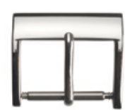
3020 INOX Edelstahl 304 poliert Breiten (mm): 14, 16, 18, 20, 22