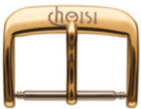
2100 PVD 2N Logo in Laser schwarz