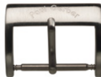
3020 INOX satiniert Photochemisch