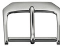
2105 INOX Edelstahl 316L fasspoliert Breiten (mm): 10, 12, 14, 16, 18, 20, 22