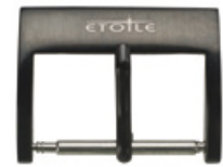
3020 PVD schwarz Logo in Laser weiss

Die meisten Schnallen können auch bei kleineren Stückzahlen graviert werden. Folgende Verfahren sind für Ihr Logo oder Marke möglich: