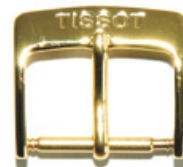
3006 PVD 2N Logo gestanzt (vertieft)