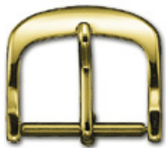
3100 Aluminium gelb Breiten (mm): 10, 12, 14, 16, 18, 20

Die Schnallen können auch graviert werden (Laser weiss oder schwarz).