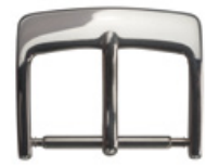
3006 INOX Edelstahl 304 poliert Breiten (mm): 8, 10, 12, 14, 15, 16, 18, 20, 22, 24