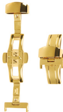
400 PVD Edelstahl 316L, PVD 2N handpoliert Breiten (mm): 12, 14, 16, 18, 20, 22, 24