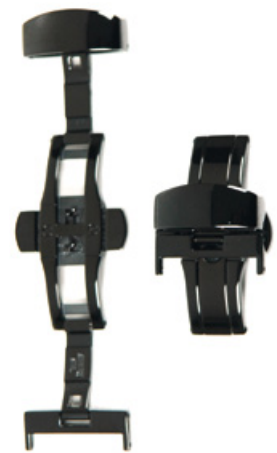
Andere Farben auf Anfrage möglich

Verglichen mit Dornschnallen weisen Verschlüsse einige entscheidende Vorteile auf: Einerseits eine grössere Sicherheit (auch bei geöffnetem Verschluss bleibt die Uhr am Handgelenk, sie fällt nicht zu Boden), andererseits ein besserer Tragekomfort. Und schliesslich kann der Verschluss rasch geöffnet oder geschlossen werden.