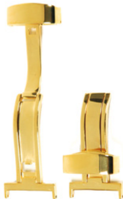
300 PVD Edelstahl 316L, PVD 2N handpoliert Breiten (mm): 10, 12, 14, 15, 16, 18, 20, 22