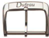
1511 INOX Photochemisch, schwarz