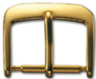
3006 vergoldet Edelstahl 304 poliert / vergoldet Breiten (mm): 8, 10, 12, 14, 15, 16, 18, 20, 22, 24