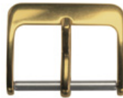
3104 Aluminium gelb Breiten (mm): 8, 10, 12, 14, 16, 18, 20, 22, 24