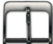
3105 Aluminium weiss Breiten (mm): 8, 10, 12, 14, 16, 18, 20, 22, 24