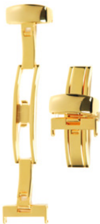
200 PVD Edelstahl 316L, PVD 2N handpoliert Breiten (mm): 12, 14, 16, 18, 20, 22