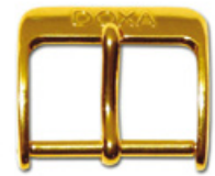
1900 vergoldet Logo gestanzt (erhaben)