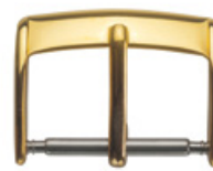
3014 vergoldet Edelstahl 304 poliert / vergoldet Breiten (mm): 8, 10, 12, 14, 16, 17, 18, 19, 20, 22