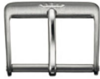
1900 INOX gebürstet Logo gestanzt (erhaben)