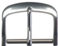
3101 Aluminium weiss Breiten (mm): 8, 10, 12, 14, 16, 18, 20