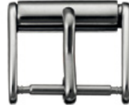
3601 INOX Edelstahl 304 poliert Breiten (mm): 14, 16, 18, 20